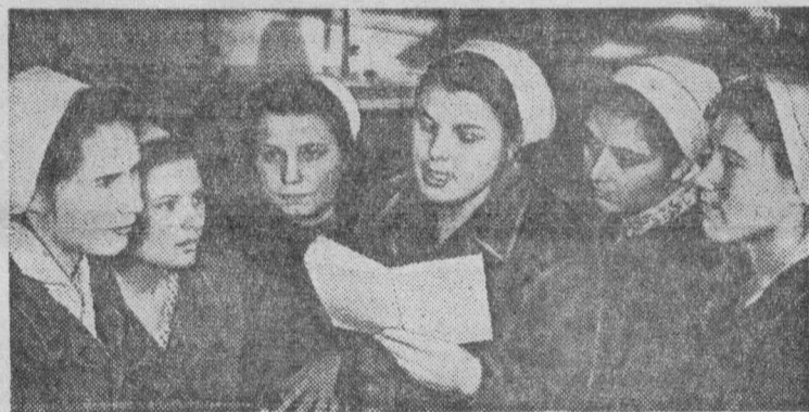
На снимке: члены бригады коммунистического труда сигаретного цеха табачной фабрики. Они внимательно изучают материалы XXII съезда КПСС. Вот и сейчас, в обеленный перерыв, они собрались вместе, чтобы почтить Программу партии — программу строительства коммунизма в нашей стране.