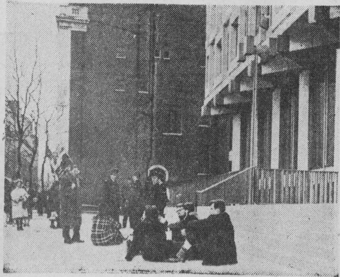
Общественность Англии гневно протестует против ядерных испытаний, проводимых США на острове Рождества. Борцы за мир установили пикеты у здания посольства США в Лондоне. На снимке: группа участников сидячей демонстрации у входа в посольство США.