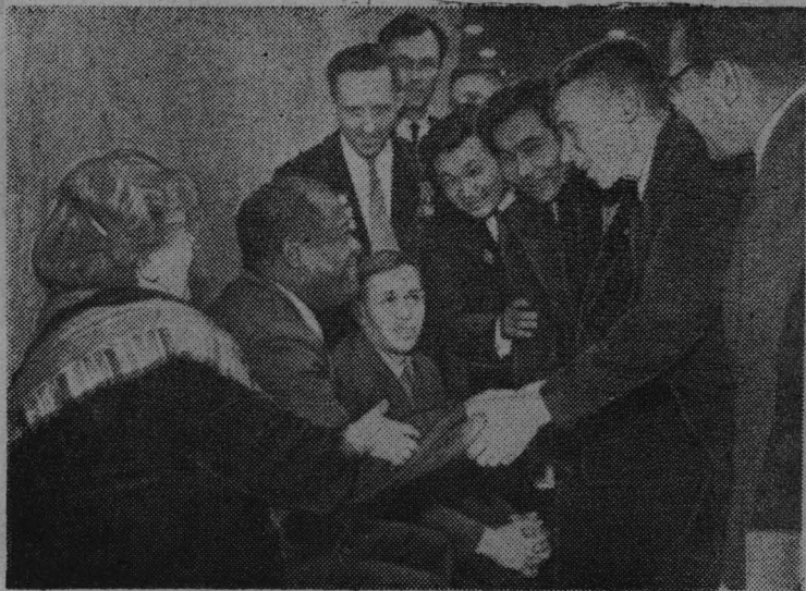
МОСКВА. XXII съезд Коммунистической партии Советского Союза.

НА СНИМКЕ: делегаты съезда приветствуют гостей из США — председателя Национального комитета Коммунистической партии США Элизабет ФЛИНН и заместителя председателя Национального комитета Генри УИНСТОНА.