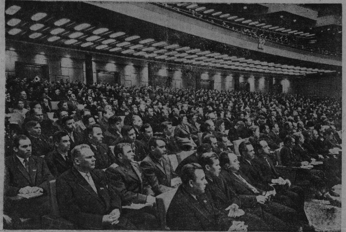
Москва. XXII съезд Коммунистической партии Советского Союза.

Нельзя скрывать от членов Пленума ЦК также важные для всей нашей партии вопросы. В