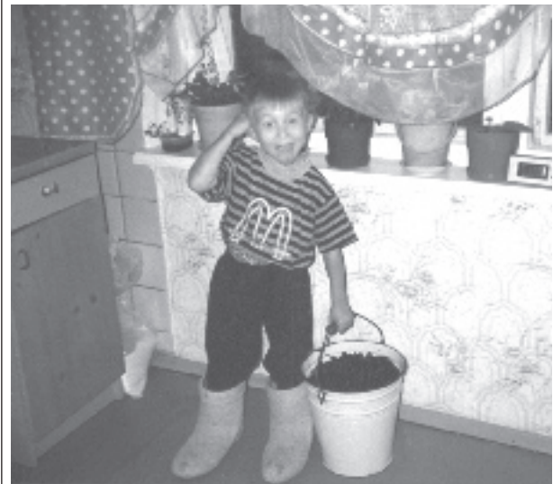
Ну и что, что маленький, ну и что, что в валенках, Посмотрите-ка в ведро - вот вам летнее добро!