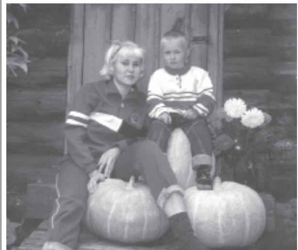
Огородные дела... Ноют руки, ноги. Ох, не зря старался я, отдохну немного. (Фото нашего читателя А. Абушаева).