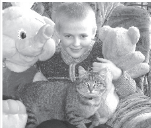
«Друзья всякие нужны, друзья всякие важны!».