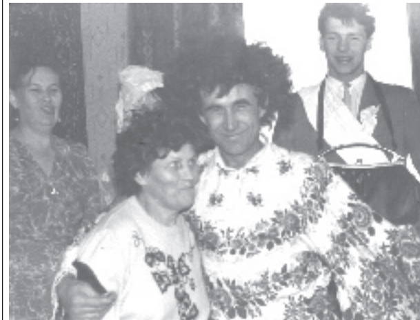
В. Петрушкина. «Цыгане шумною толпою...».