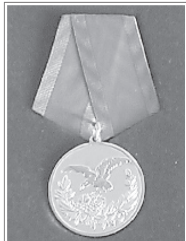
Изготовленная из чистого серебра, эта медаль – единственная в нашем городе.