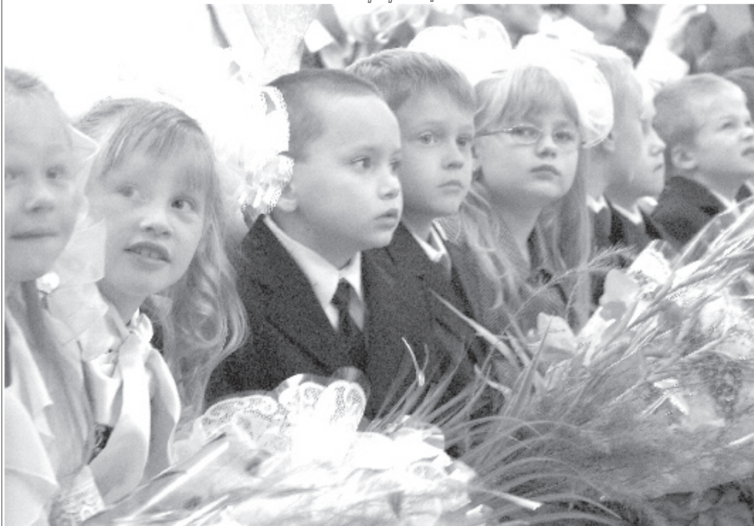
Ясным и погожим выдался в этом году первый день сентября. 3200 юных полысаевцев перешагнули пороги школ. Для 313 ребят первое сентября стало особо волнительным – теперь они первоклассники!