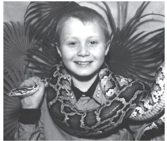
День рождения у меня - мне сегодня десять! От улыбки день светлей, а с друзьями веселей. Улыбайтесь чаще все. Мир пусть будет на земле!