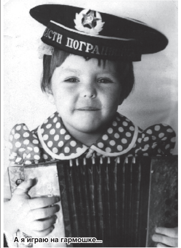
А я играю на гармошке...