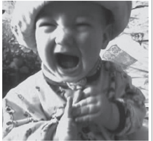
Любим хлопать мы в ладоши, Похихихать от души. Натянув панаму на уши, Поём песни от души.