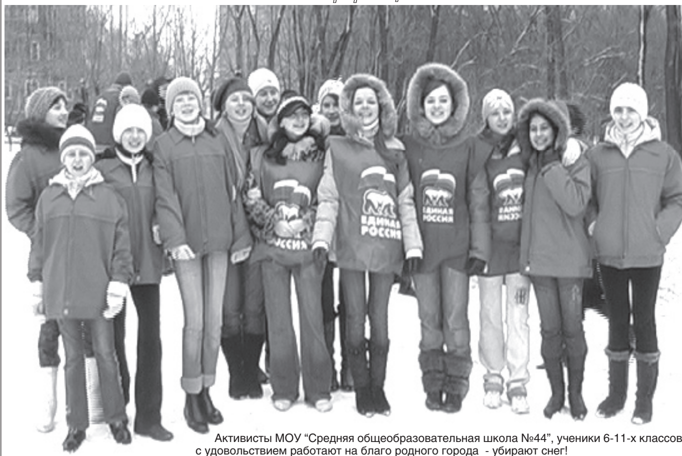
Активисты МОУ «Средняя общеобразовательная школа №44», ученики 6-11-х классов, с удовольствием работают на благо родного города - убирают снег!