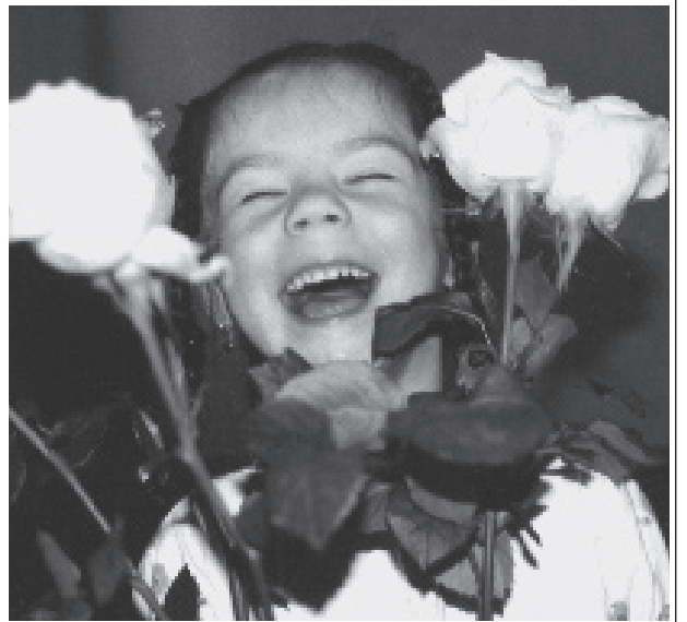
Лолита. «Какой нынче веселый праздник!».