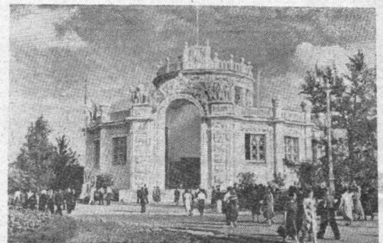
Москва. Всесоюзная сельскохозяйственная выставка. Павильон «Картофель и овощи».