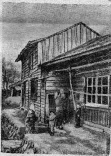
Северная Япония. Хижины, в которых ютятся трудящиеся.