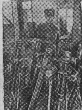
Отремонтированные трофейные немецкие минометы, готовые к отправке в Действующую армию.