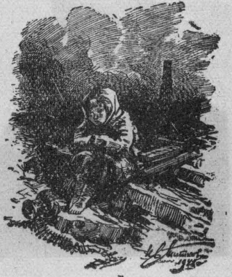
Без матери. Зарис. с натуры худ. Ив. Титкова

Пленный солдат Эрих Вурхе рассказывает: «На пути следования из Германии на фронт на одной из железнодорожных станций на линии Псков — Рига я видел эшелон из шести товарных вагонов, в которых находились советские женщины и девушки... Их увозили на сельскохозяйственные работы в Восточную Пруссию, в Германию, в рабство».