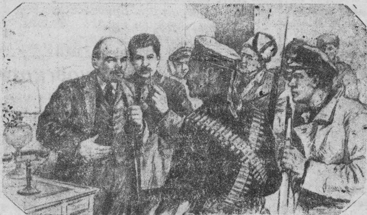
когда в нашу страну вторгся враг, когда немецко-фашистские банды грозят потопить в крови все наши революционные завоевания и наложить на советских людей постыдное ярмо рабства, партия большевиков, партия Ленина—Сталина вновь выступила организатором вооруженной борьбы против иноземного нашествия.

По зову своего вождя, по зову партии советский народ, как