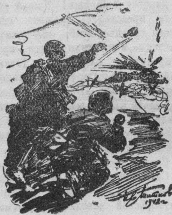
Западный фронт. Гранатометчик на поле боя.

Северо-восточнее Туапсе наши войска продолжали вести активные боевые действия и несколько продвинулись вперед. Немцы пытались предпринять контратаку, но были рассеяны артиллерийским и минометным огнем. Бойцы Н-ской части уничтожили батальон пехоты противника в районе Безымянной высоты и овладели этой высотой.