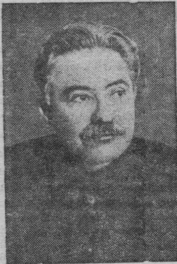
На снимке: Д. З. МАНУИЛЬСКИЙ

На XVIII съезде ВКП(б) отчетный доклад делегации ВКП(б) в ИККИ сделал тов. Мануильский