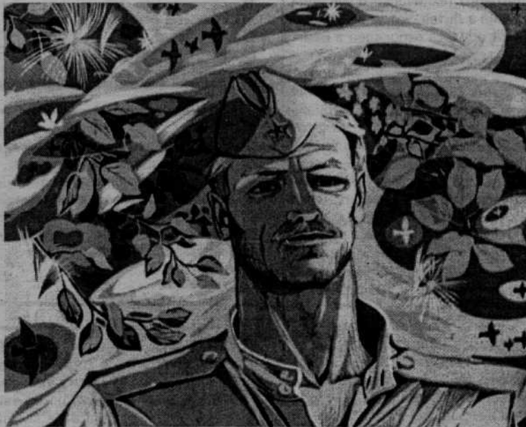
В мае 1945 года.