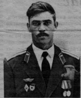
Н. И. Марамзин.