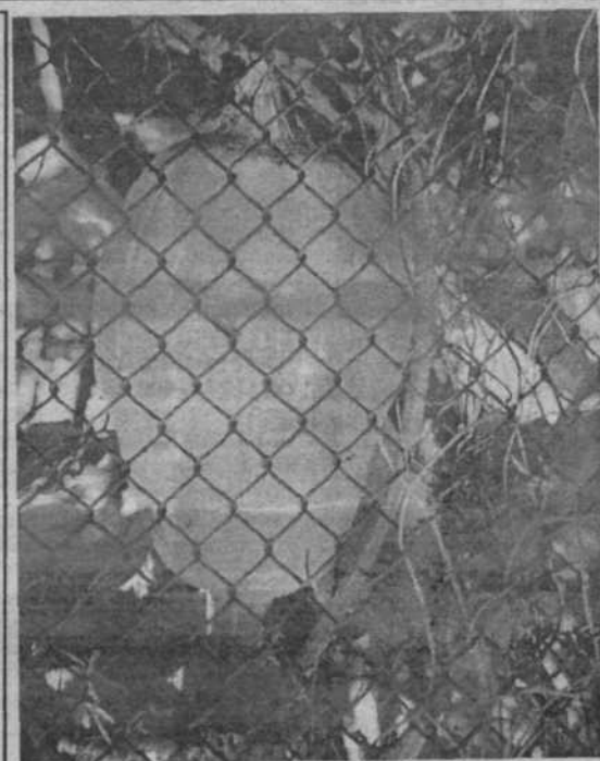
«Запретный плод»

Самое благоприятное время для посадки нарциссов, лилий, мелколуковичных цветов, клематисов.