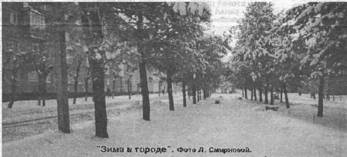
"Зима в городе".