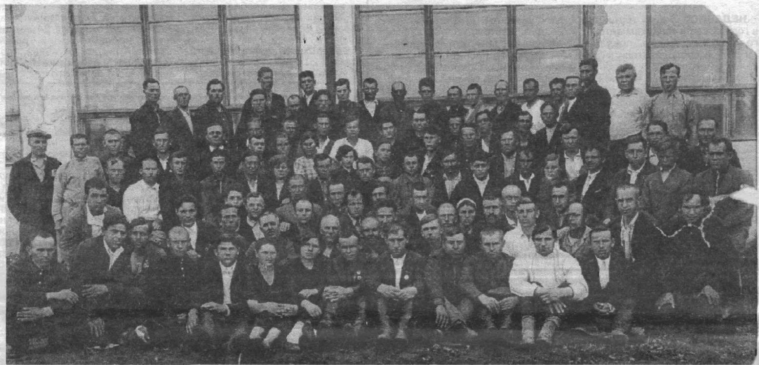
Июль 1938 года. Делегаты рудничной конференции. В их числе только что избранные члены комитета райкома угольщиков.

Фото из архива Д. П. Красноперовой, которая также была делегатом конференции.