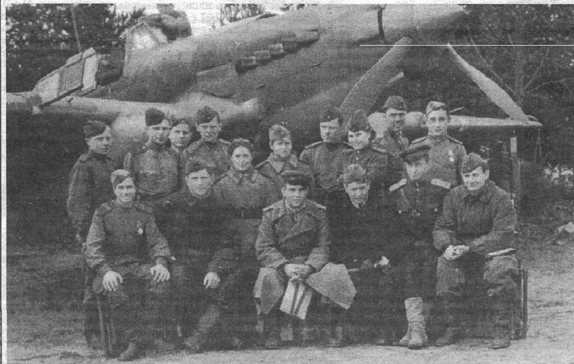
Первая эскадрилья, третье звено.