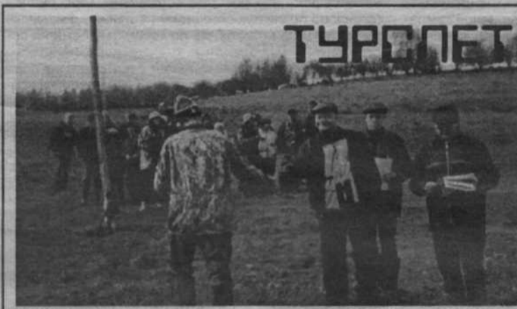
18 МАЯ в районе реки Прокина состоялся очередной 46-й летний туристический слет школьных команд города, посвященный 60-летию образования Кемеровской области. В нем приняли участие 25 туркоманд, т. е. более 300 человек, которые состязались в знаниях туртехники, санитарии, геологии, ботаники и многого другого.

Соревнования прошли на высоком уровне, несмотря на непрекращающийся дождь, ребята показали хорошую физическую и специаль-