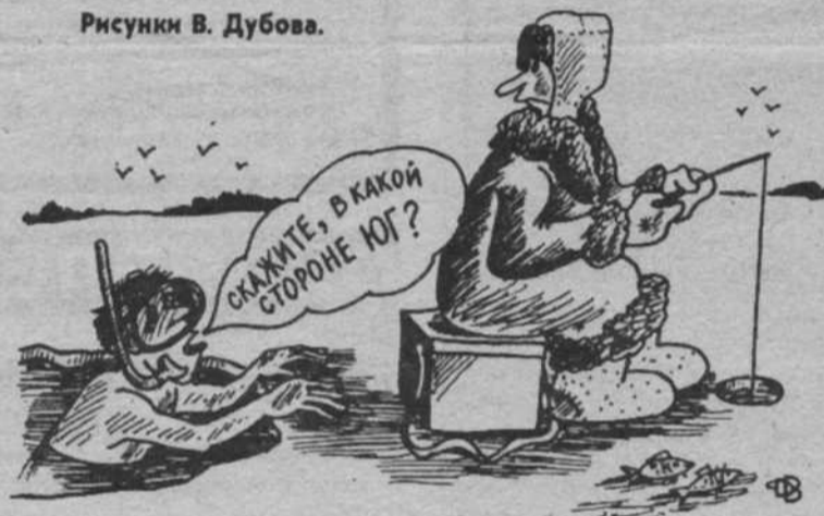
Рисунки В. Дубова.

ство ЦОФ "Сибирь", тепличного комбината в совхозе "Безруковский", строил разрез "Сибиргинский".