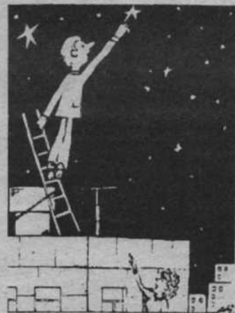
Лучше вон ту, полярче...