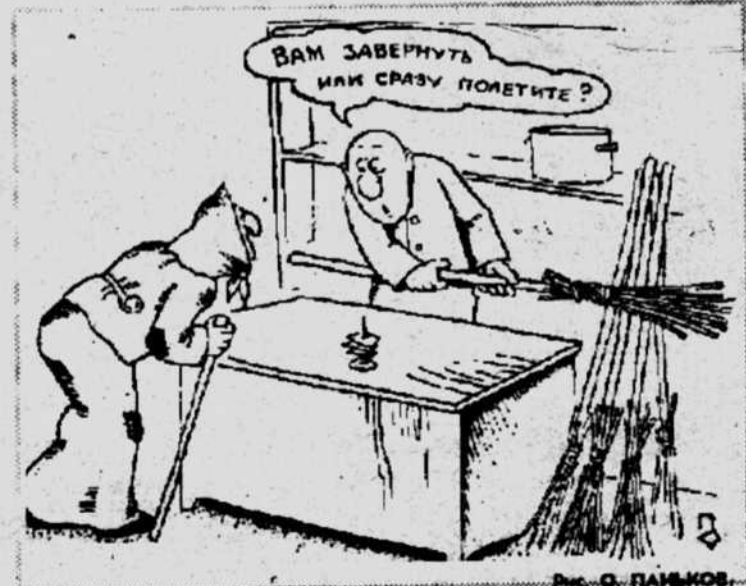
Рис. О. ПАЙКОВ.

ВЕСНА не вдруг ударит в звоны, Сперва, как будто в полусне, Очнется и тихонько тронет, Сухой сучек на старом пне. Обнимет тополь голенастый — Такой корявый и тусой! И почки вопреки ненастью Облепят веточки его. И обновления природы Уж ничему не загасит: Весна! Она затем приходит, Чтоб все на жизнь благословить.