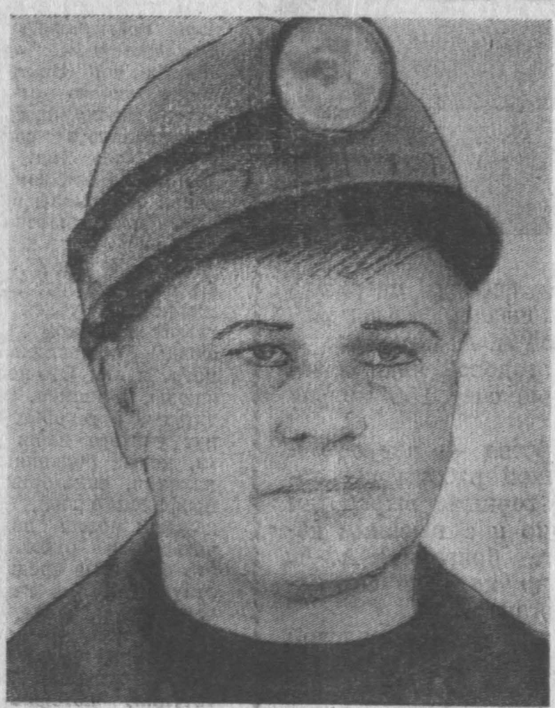
Твое партийное поручение