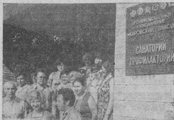
На Ленинградском производственном объединении «Кировский завод» большое внимание уделяется здоровью и отдыху тружеников предприятия.

После рабочей смены принимает отдыхающих заводской санаторий-профилакторий. Новую жизнь получили старинные особняки в поселке Стрельна, где находится пансионат «Красные зори». Для прохождения стационарного лечения построена многопрофильная больница.