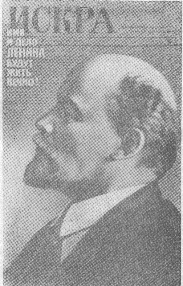
Плакат художника Б. Березовского. Издательство «Плакат».

Газета выходит по вторникам, четвергам и субботам