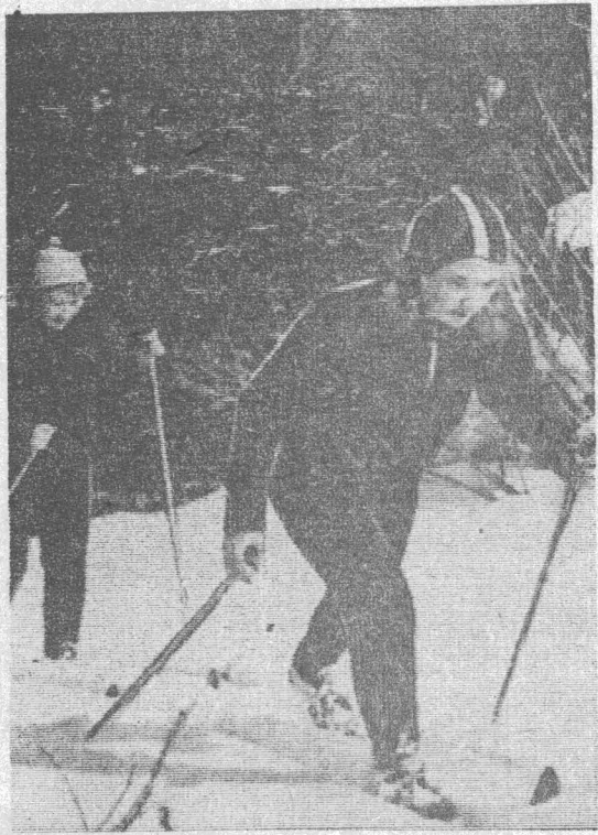
В выходной.

стороне хоккеистов училища. Они победили со счетом 8:3. После первого круга первенства впереди команда СГПУ-45, набравшая 6 очков, на втором месте — шахты «Капитальная», на третьем — шахты «Высокая». * * * Успешно выступили наши хоккеисты в областном первенстве. Обе встречи с кемеровской командой «Кировец» и ленинско-кузнецкой «Шахтер» закончились ничьей с результатом — 3:3. Пока наша команда занимает вторую строчку в таблице первенства области. Н. ТАТАРИНЦЕВ, председатель комитета физкультуры.