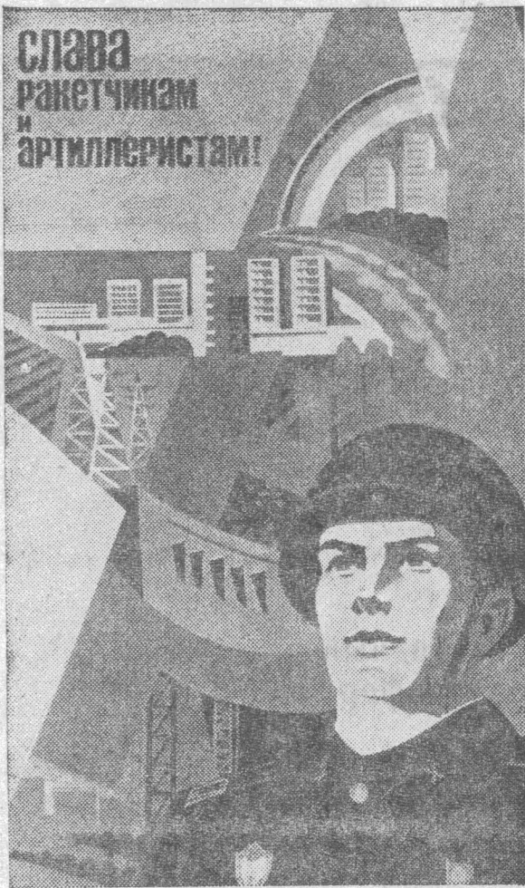
Плакат художников Л. Бельского и В. Потапова. Издательство «Плакат».