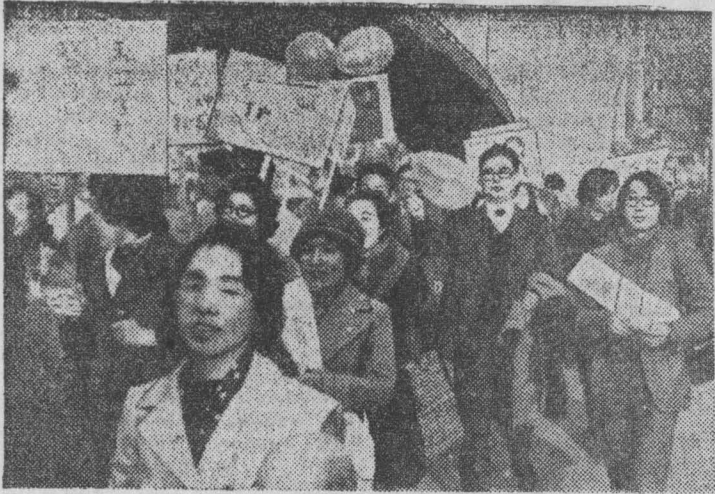
Классовые бои японских трудящихся направлены на защиту экономических и политических прав. Не проходит дня без митингов и демонстраций.

НА СНИМКЕ: участники демонстрации, организованной Всеяпонским профсоюзом учителей, проходят по улицам Токио с требованиями прекращения роста дороговизны.