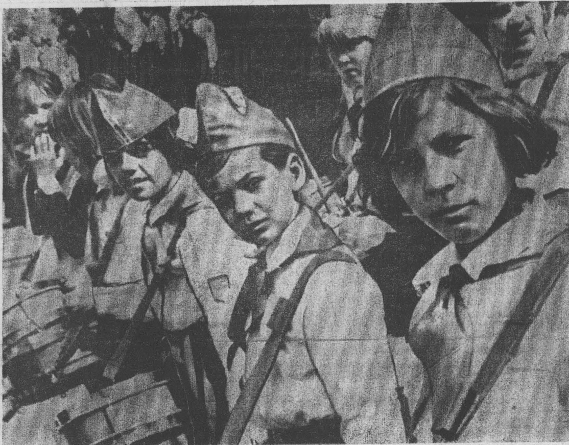
НА СНИМКЕ: пионерия на марше.