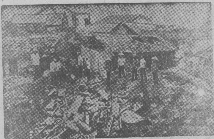
На снимке: уничтоженные американскими бомбами жилые дома на улице Хангтвен в городе Намдинь.