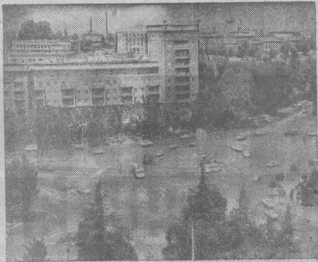
Столица Грузинской ССР — Тбилиси. Площадь Героев.

— это путь всего нашего великого содружества народов, что сама природа социалистического общественного строя, последовательное осуществление ленинской национальной политики сплотили народы нашей страны, превратили их дружбу в движущую силу развития советского общества, в неиссякаемый источник энергии и творчества всех наций и народностей Советского Союза.