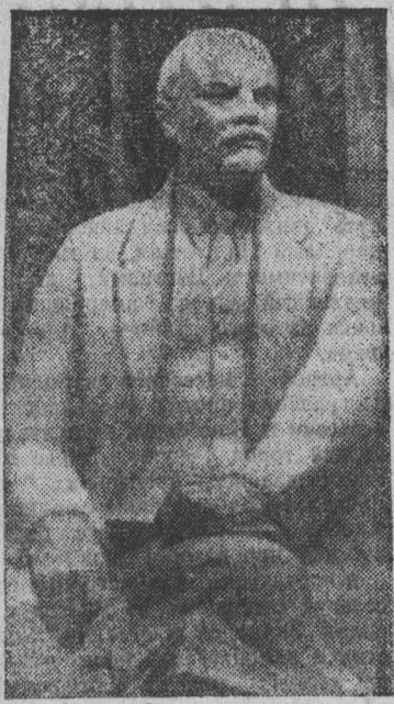
УЛЬЯНОВСК. Ленинский мемориальный центр. Скульптура В. И. Ленина в Ленинском торжественном зале. Автор — народный художник РСФСР П. И. Бондаренко.