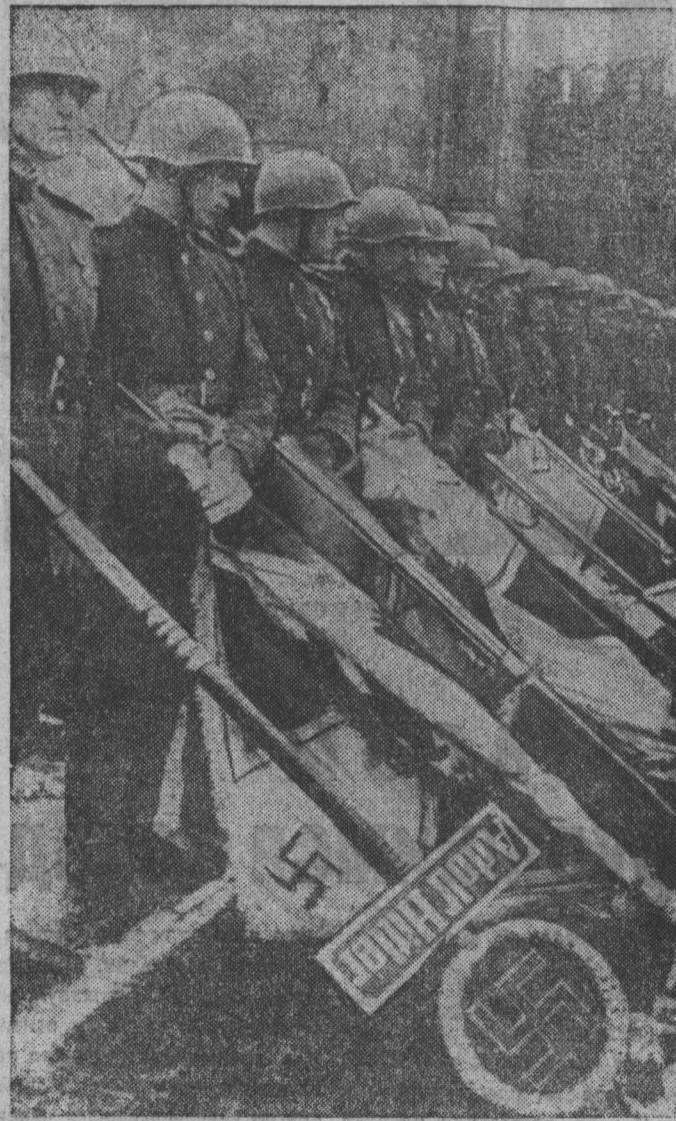
Москва. Июнь 1945 года. Парад Победы. Эти гитлеровские знамена будут брошены к подножию Мавзолея В. И. Ленина.

Как сложилась наша послевоенная судьба? Василий работает в строительном управлении № 6. У него два сына и дочь. Супруга тоже работает. И я увидел, что эта семья по-настоящему счастлива.