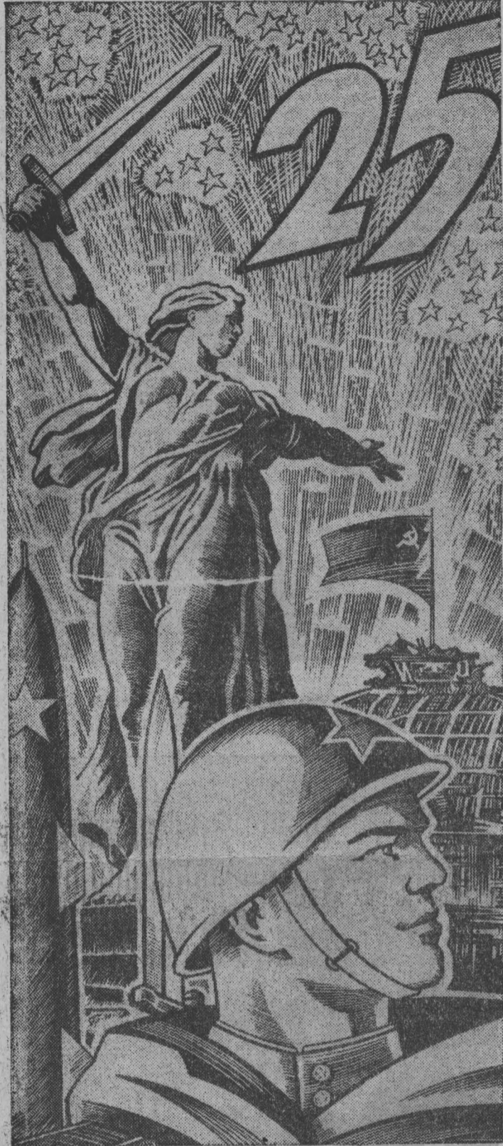
Плакат художника С. ГРИНЬКО.