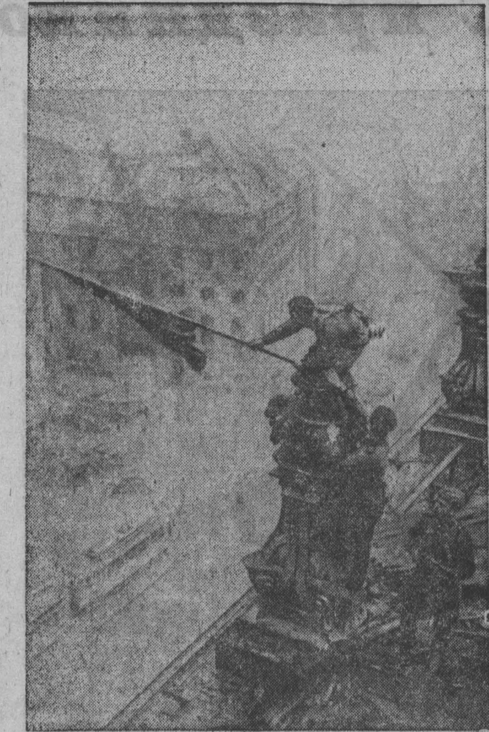
1945 год. Советский флаг над рейхстагом в Берлине.

Часто Василию приходилось заменять старшего на батарее. То есть быть заместителем командира батареи на огневой позиции. Помню, в этой должности в Норвегии под городом Киркинес он был ранен в ногу.