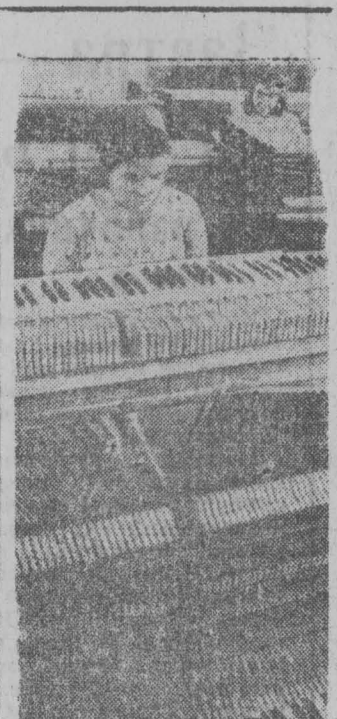
Саратовская фабрика музыкальных инструментов изгостив в этом году около двух с половиной тысяч пианино и три тысячи гармоник.

Сейчас здесь выпускают новую модель пианино «Прелюдия», которая отличается улучшенным звучанием и внешним видом.