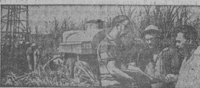
РЕСПУБЛИКА КУБА. Большую помощь Кубе оказывают в освоении недр советские геологи и геофизики. При их участии найдены в этой стране нефтяные месторождения и полезные ископаемые.

Комментируя опрос, проведенный службой Харриса, журнал «Тайм» писал, что 80 процентов американцев просто устали от войны и полагают, что войну не следовало начинать, и что она означает бессмысленную трату жизней.