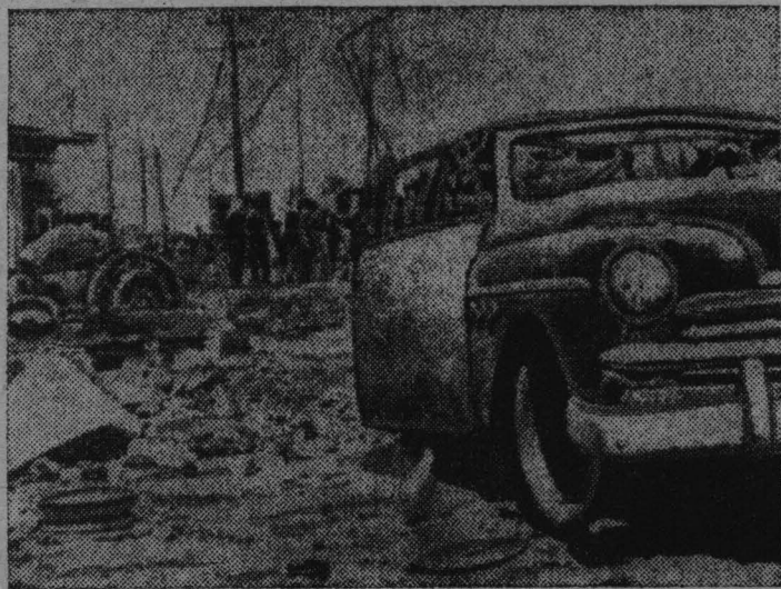
На границах Иордании продолжаются провокации израильских войск. Многие пограничные поселки и деревни обстреляны из орудий и пулеметов.