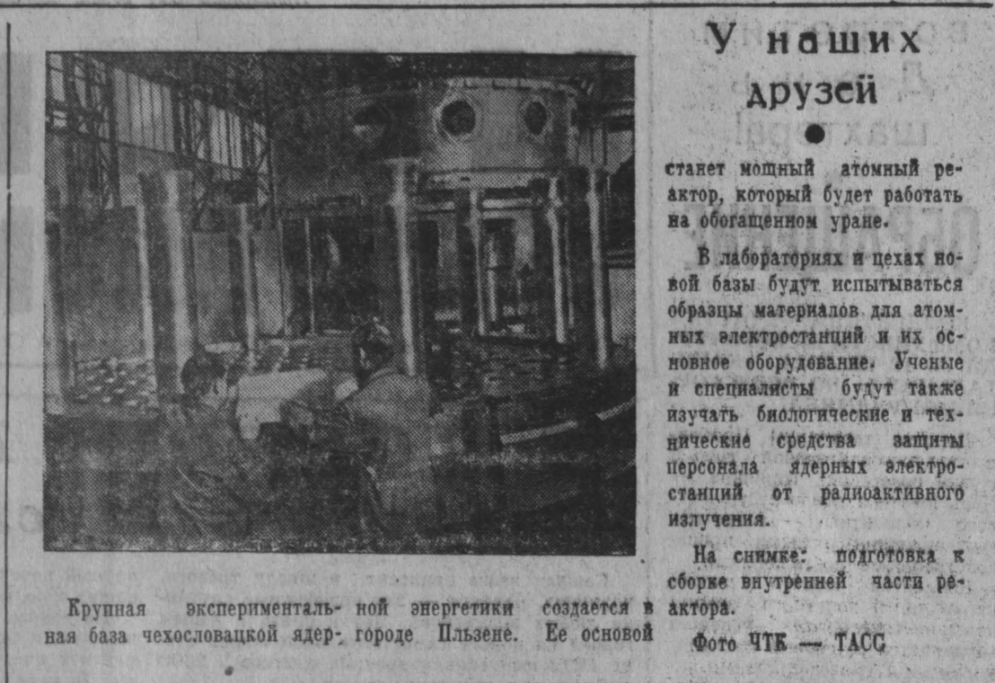
Крупная экспериментальная энергетика создается в ява база чехословацкой ядер- городе Пльзене. Ее основой

суетиться и не искать нужного среди ненужного, ибо уход за своим рабочим местом — это все равно, что уход за самим собой. НОТ позволяла добиться высоких результатов роста эффективности труда всегда и везде. Вот что по этому поводу говорил один из первых в стране поборонок и пропагандистов этой отрасли науки, бывший директор Центрального института труда А. К. Гастев. «Даже, если бы мы, например, копали землю на огороде, нам сейчас же нужно было бы задуматься над формой лопаты, каной ширины должны быть грады, чтобы их лучше экономнее, скорее можно было поливать, эконоимее и скорее можно было полоть; или если бы мы даже стали сегодня возить на поле павод, то и там мы должны были бы попробовать принцип научной организации труда».