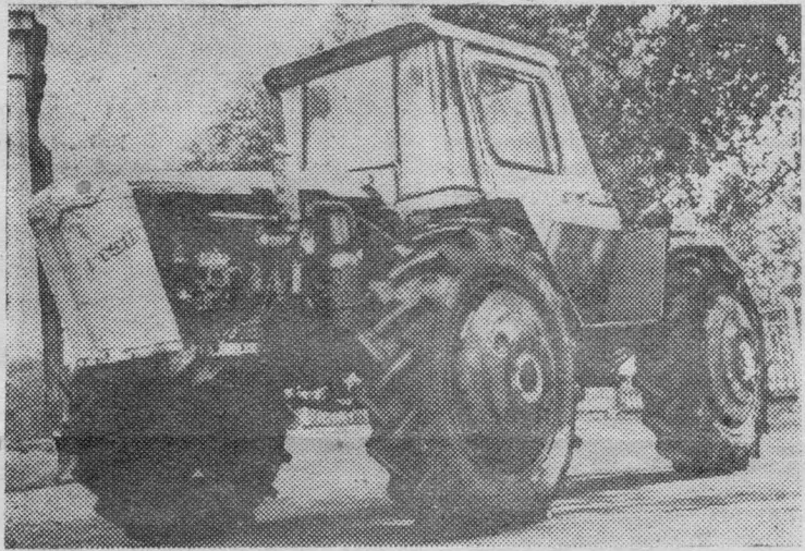
ТРАКТОР с гидрообъемной трансмиссией и четырьмя ведущими колесами создан на Липецком тракторном заводе.

начальник 10-го участка шахты «Капитальная-2».