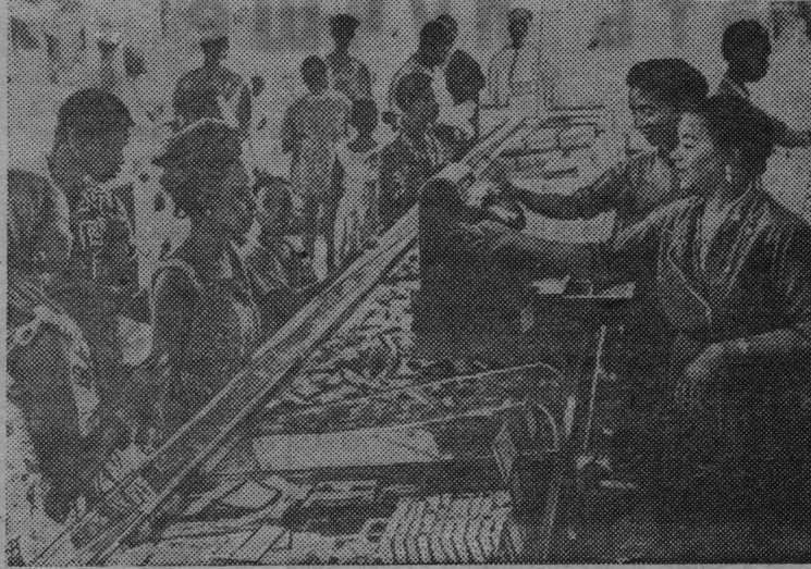
Население Гвинеи в период французского колониального владычества обиралось французскими и местными купцами. В Республике Гвинея созданы государственные магазины, в которых товары продаются по справедливым ценам.

На снимке: в государственном универсальном магазине в столице страны — Конакри.