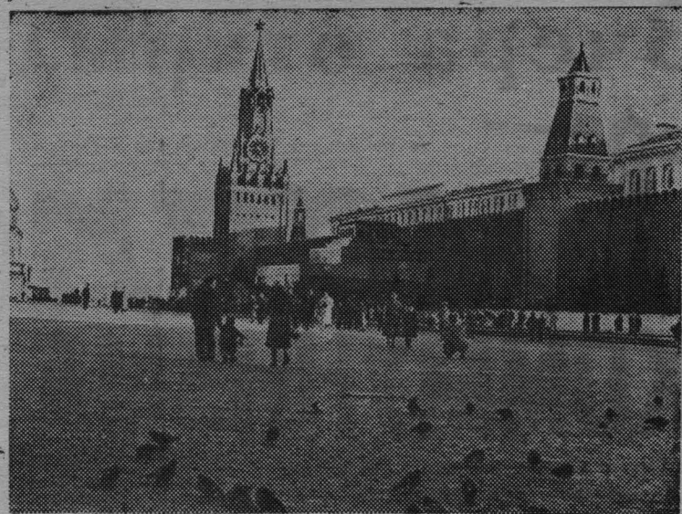
Москва. Красная площадь.

СОБЫТИЕ , к достойной встрече которого были направлены все помыслы и усилия трудящихся Родины, произошло: вчера в Кремле начал свою работу XXII съезд Коммунистической партии Советского Союза. Съезд примет Программу партии, проект которой мы, работники