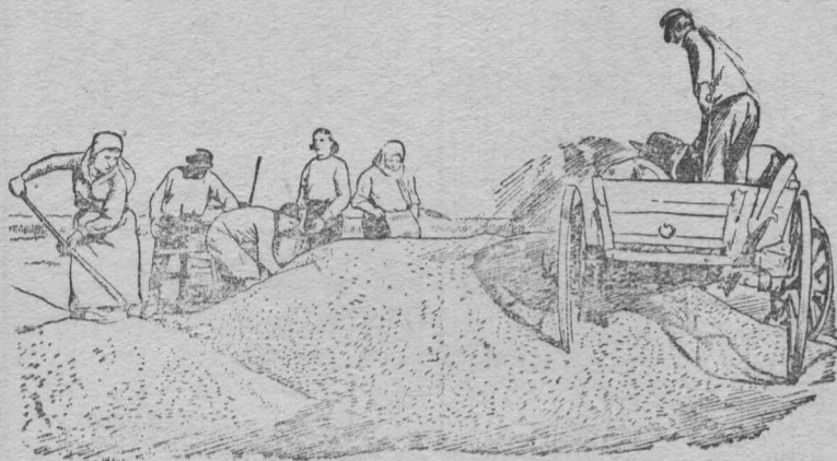
Алтайский край, Карасукский район.

Надо покончить с таким негодным руководством. Сейчас же подготовить тока, установить молотилки и организовать круглосуточную работу на молотье, при любой погоде.