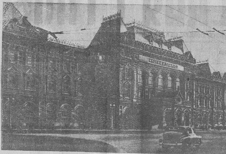
Москва. Здание Центрального музея В. И. Ленина на площади Революции.

17 января мною прочитан реферат на тему: «Развитие товарищем Сталиным ленинской теории империализма и социалистической революции». Реферат был одобрен на семинаре консультанта