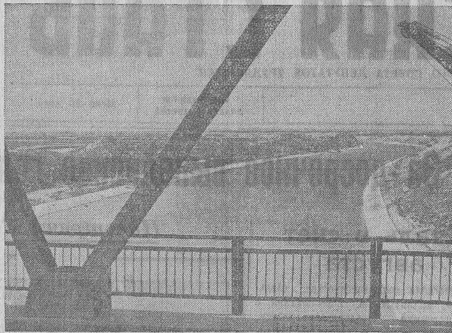
Волго-Донской судоходный канал. Участок в водораздельном районе.

Избран новый состав партийного бюро. Е. ЛАСКАРОНСКАЯ.