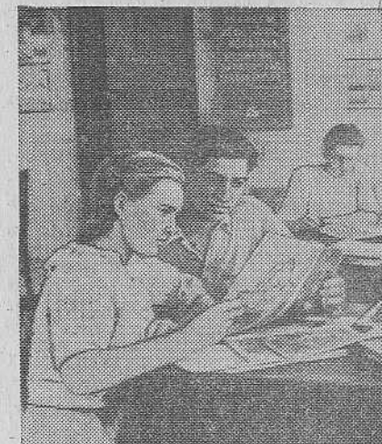
В выходной день в читальном зале парка культуры и отдыха металлургов.

Среди коммунальных предприятий на первое место вновь вышел коллектив водоканалтреста (начальник тов. Херувимов, секретарь парторганизации тов. Готвальд, председатель месткома тов. Фалеев). План по валовому доходу выполнен на 119 процентов, себестоимость снижена на 12 процентов против плана. За коллективом оставлено переходящее Красное знамя горкома ВКП(б) и горисполкома.