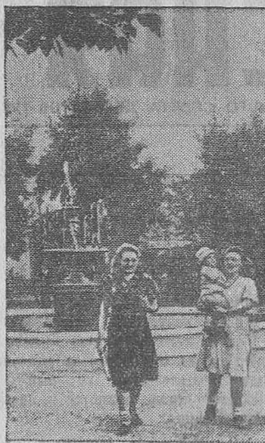
Сквер у заводоуправления.