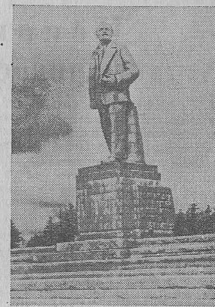
Канал имени Москвы. Монумент В. И. Ленина работы народного художника СССР С. Д. Меркурова, установленный у входа в канал со стороны Большой Волги.

Исторический музей училища организовал выставку документов, иллюстрирующих беспримерные подвиги русских моряков под командованием Нахимова в Синопском бою и героическую оборону Севастополя от англо-французских интервентов. (ТАСС).