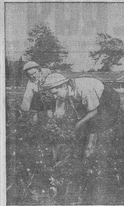
За сбором цветов.

Пленум райкома ВКП(б) в своем решении наметил конкретные мероприятия по улучшению партийно-политической работы на шахтах района.