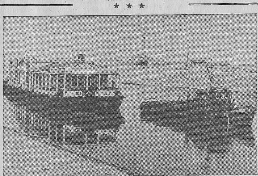
Волго-Донской судоходный канал. Теплоход «Славный», совершивший первый рейс от Ростова до порта Цимлянский, буксирует дебаркадер для пристани «Кривская» в Цимлянском море.