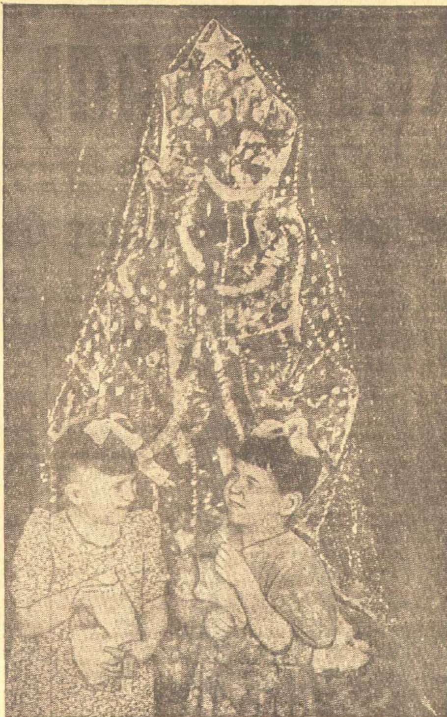
Хороши новогодние подарки!